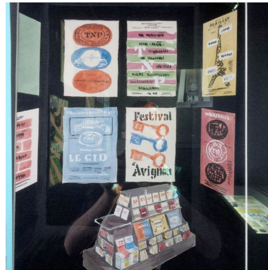
Exposition Jacno © Radio France - Michel Flandrin.

Diffusion du mercredi 29 mai 2019 Durée : 32min