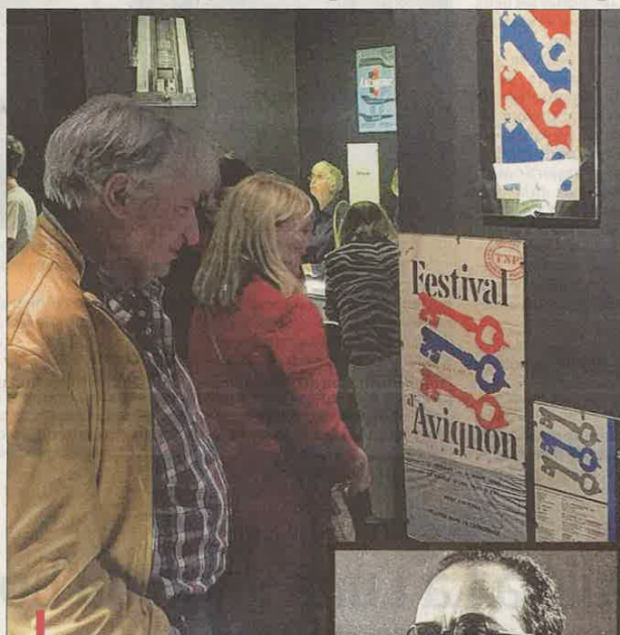
Jusqu'au 24 juillet, l'exposition "Signé Jacno, un graphisme brut pour un théâtre populaire" célèbre cet artiste de l'ombre, graphiste et affichiste qui collabora avec Jean Vilar dès 1951, à Paris comme à Avignon.