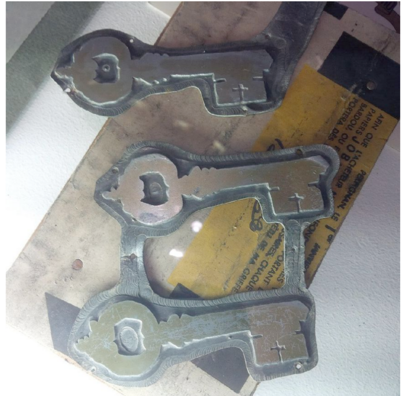
Tampon des "Trois clés".

"Jacno un graphiste brut pour un théâtre populaire", actuellement Maison Jean Vilar, Montée Paul Puaux Avignon.