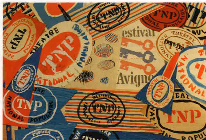
Affiches de Jacno © M.C.

Vous dites « un homme de caractères »... Oui, il y a plusieurs Jacno, et les jeux de mots sont nombreux pour l'évoquer ! Il est amoureux des alphabets, en crée de différents pour chaque projet qu'il mène : « réclames » de magazines (Chanel, Lip...), programmes de cinéma, de théâtre... Il invente des polices de caractères, le FILM et le SCRIBE pour les fonderies Deberny et Peignot, il crée un alphabet pour les éditions Quillet... « Homme de caractères » donc, mais aussi « homme qui s'affiche », « homme qui s'emballe », « homme à la page »... Il effectue tous ses croquis, ses essais, à la main, use de collages, de bromure, de maquettes, multiplie les essais de dessin, de construction, en laissant transparaître dans le produit fini une spontanéité vive, un élan inspiré, gommant avec élégance tout le travail effectué en amont, le rendant invisible. Il a aussi mis en page de