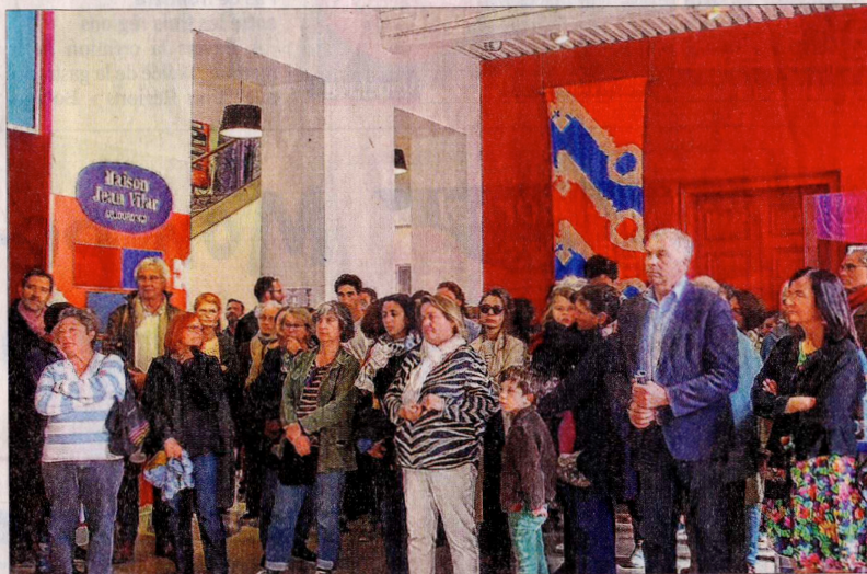
Le public devant la bannière aux Trois Clés signée Jacno, lors du vernissage de l'exposition.

Comme beaucoup d'artistes de l'ombre, ses réalisations sont plus célèbres que son nom.