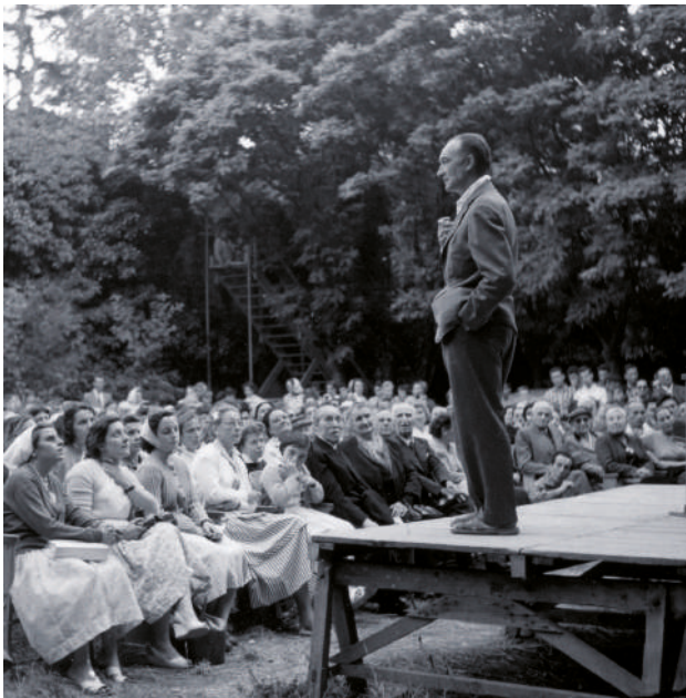
Jean Vilar pendant les Rencontres du Verger 1958