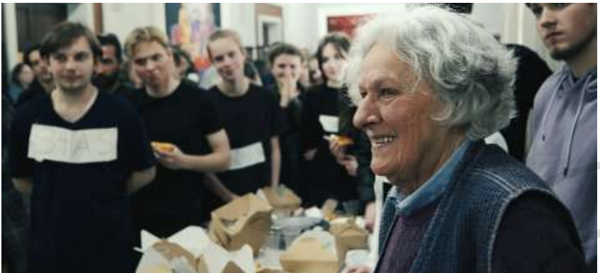
Au bord de la guerre

Organisé par l'Association Jean Vilar / Maison Jean Vilar en collaboration avec le Théâtre du Soleil et Desk Russie , avec le soutien du Festival d'Avignon