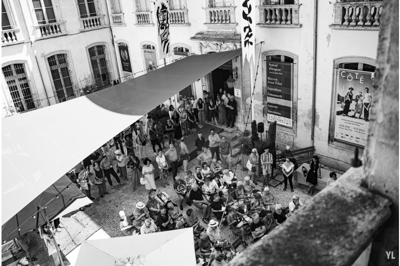
Calade de la Maison Jean Vilar, Festival d'Avignon 2023