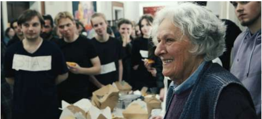
Au bord de la guerre

Organisé par l'Association Jean Vilar / Maison Jean Vilar en collaboration avec le Théâtre du Soleil et Desk Russie , avec le soutien du Festival d'Avignon