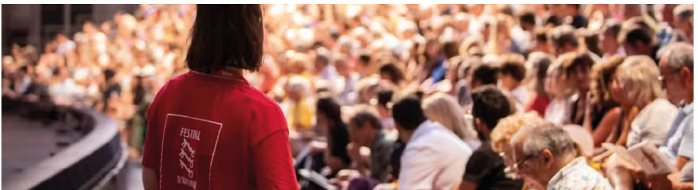
Représentation dans la cour d'honneur du Festival

Le Festival d'Avignon est ainsi devenu une référence internationale, un marqueur majeur de l'identité de la ville et de son histoire contemporaine.