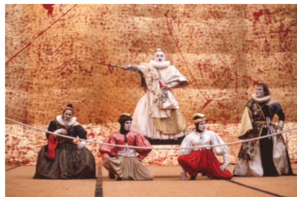
Richard II , d'Ariane Mnouchkine, 1982