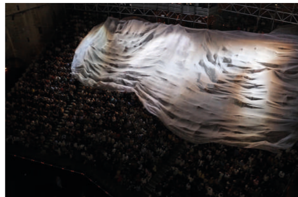
Inferno , de Romeo Castellucci, 2008