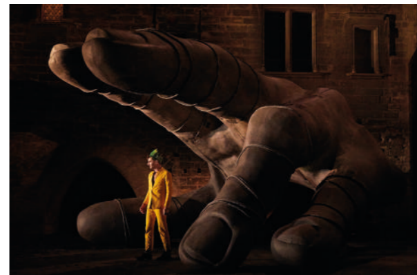
Thyeste de Thomas Jolly, 2018