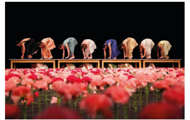
Tanzabend : Nelken de Pina Bausch, 1983