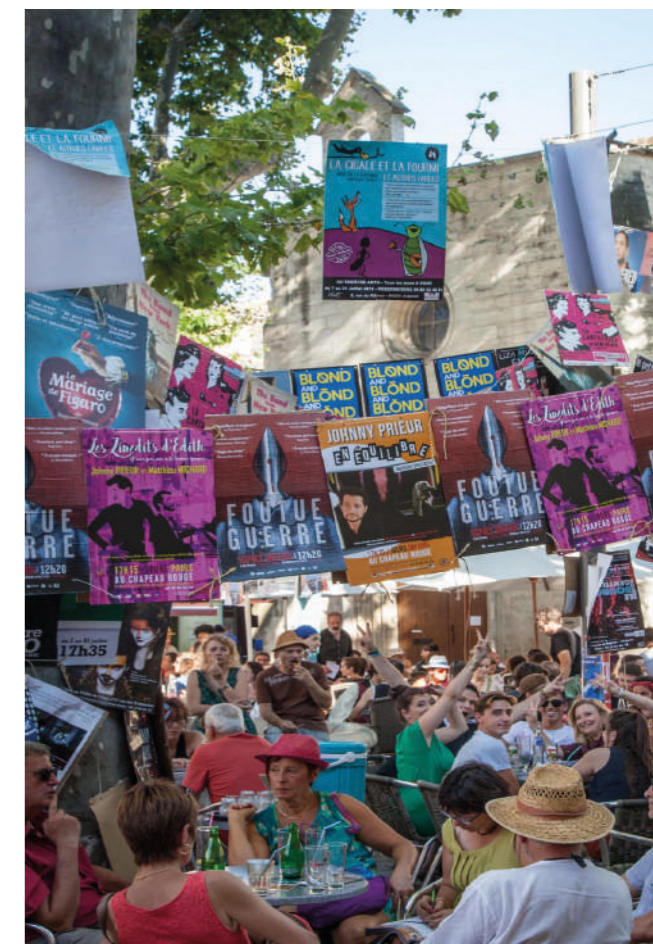
Le OFF dans les rues d'Avignon