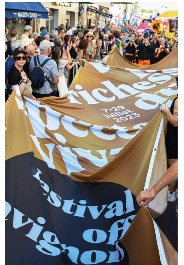
Parade du OFF dans les rues d'Avignon, 2023