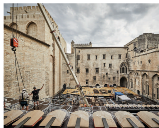
Construction des nouveaux gradins de la Cour d'honneur, 2021