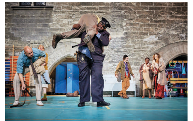
Welfare , de Julie Deliquet, 2023