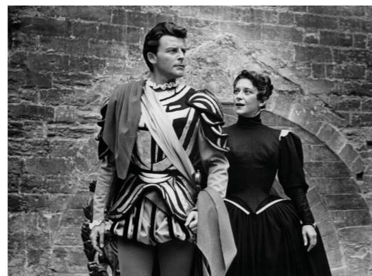
Maria Casarès (Chimène) et Gérard Philipe (Rodrigue) dans le Cid de Pierre Corneille, mise en scène Jean Vilar, 1954