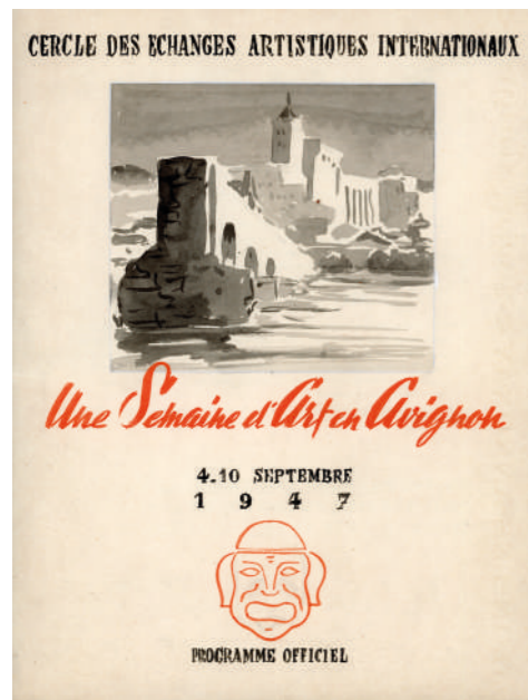
Programme de La Semaine d'Art en Avignon, qui deviendra le Festival d'Avignon à partir de 1948 Fonds association Jean Vilar