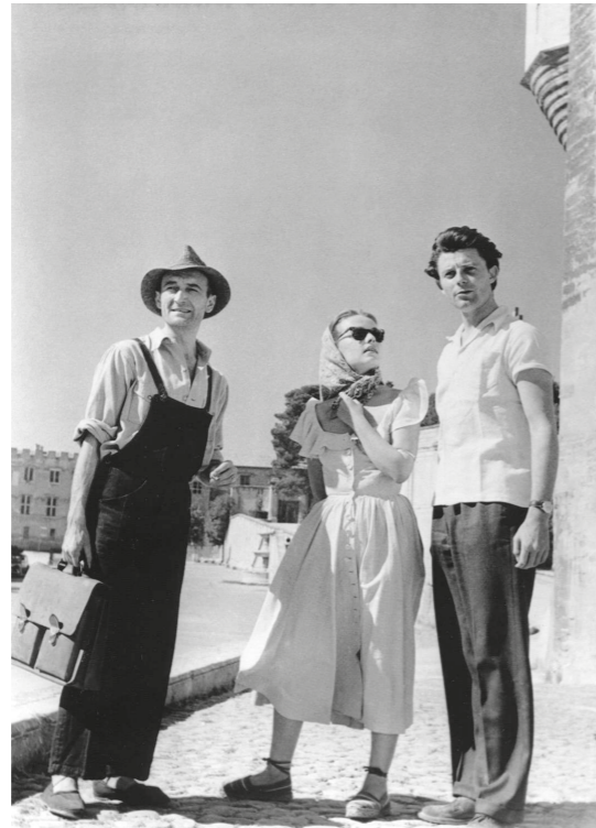
Jean Vilar, Jeanne Moreau et Gérard Philipe lors du V e Festival d'Avignon, création du Prince de Hombourg, Parvis du Palais des Papes, Avignon, 1951