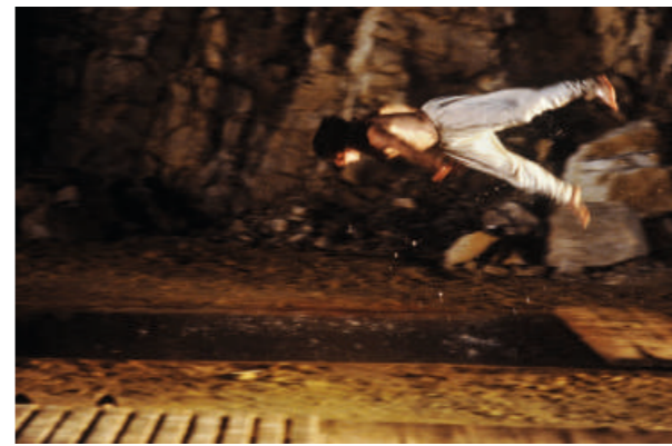
Le Mahabharata , de Peter Brook, 1985