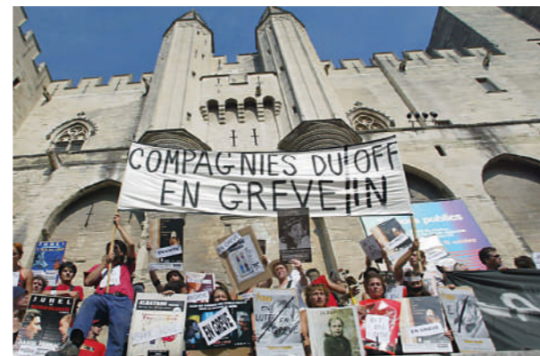
Grève des intermittents du spectacle et annulation du Festival d'Avignon 2003 Annulation du Festival d'Avignon 2003