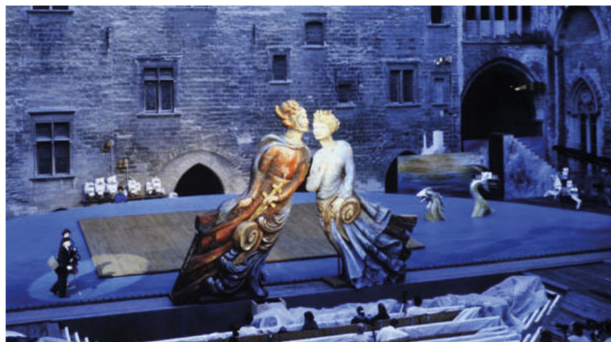
Le Soulier de satin d'Antoine Vitez dans la Cour d'honneur du Palais des Papes, 1987

Elle sera prolongée, à partir de 2026, par une exposition itinérante ce qui lui permettra d'aller à la rencontre des publics sur un large territoire.