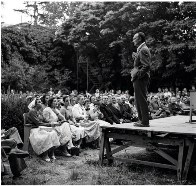
Jean Vilar au Jardin du Verger, 1954

Jean Vilar est aujourd'hui une référence pour tous ceux qui réfléchissent et travaillent à partager l'art et la culture avec le plus grand nombre.