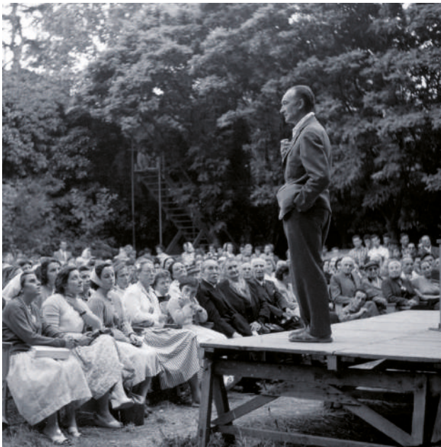
Jean Vilar pendant les Rencontres du Verger 1958