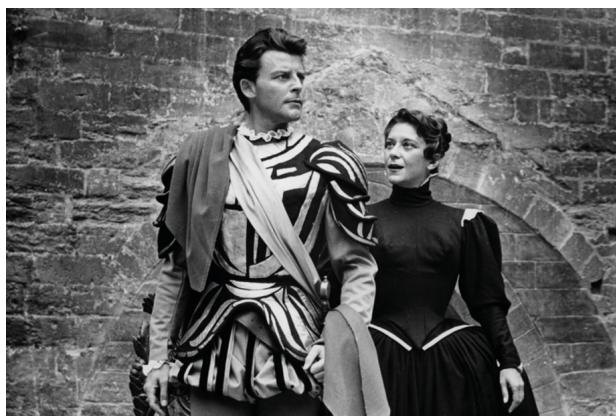
Maria Casarès et Gérard Philipe dans le Cid de Pierre Corneille, mise en scène Jean Vilar, 1958