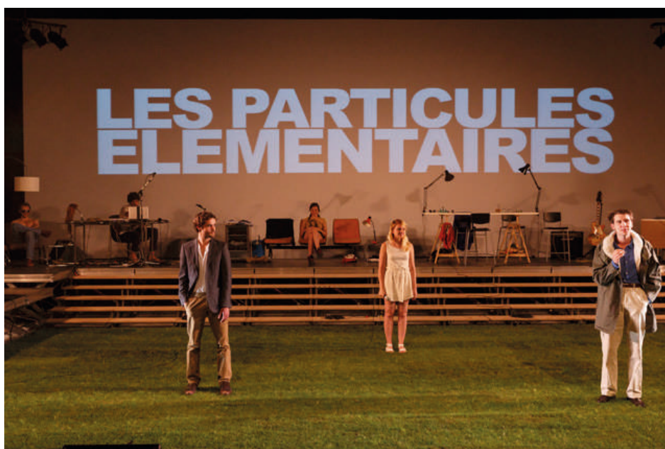
Les Particules élémentaires lors du Festival d'Avignon 2013