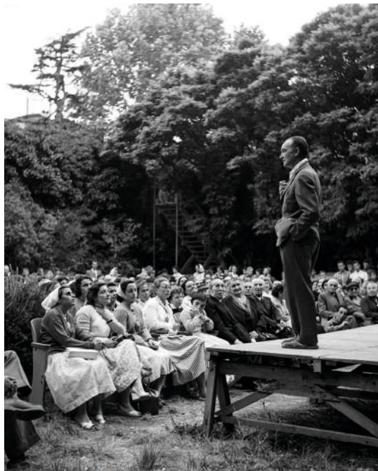
Jean Vilar au Jardin du Verger, 1954

Jean Vilar est aujourd'hui une référence pour tous ceux qui réfléchissent et travaillent à partager l'art et la culture avec le plus grand nombre.