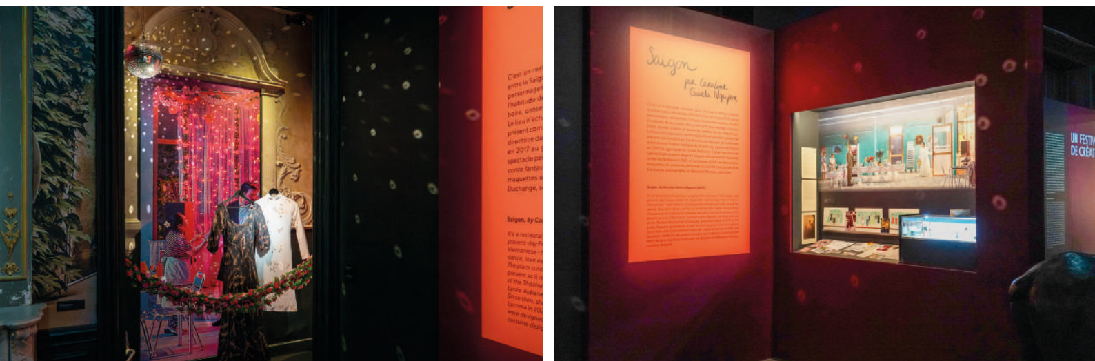
Exposition Les Clés du Festival