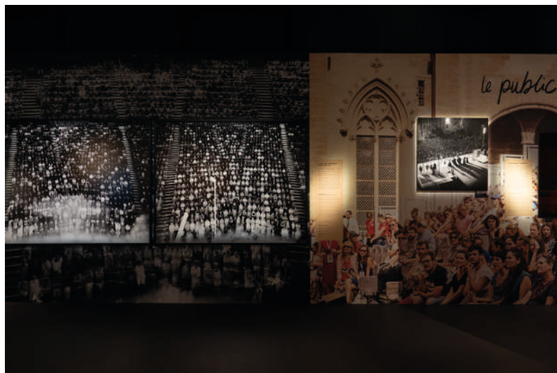
Vues d'exposition Les Clés du Festival

Frédéric sera avec nous, le temps du Festival, avec un grand tirage d'une de ses photographies sur le mur de calade.