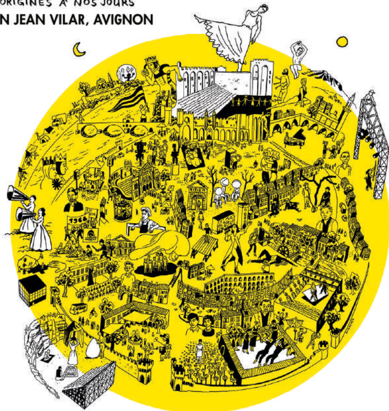
Illustration © François Ollislaeger

L'AVENTURE DU FESTIVAL D'AVIGNON DES ORIGINES À NOS JOURS MAISON JEAN VILAR, AVIGNON