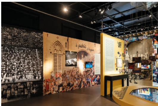
Vues d'exposition Les Clés du Festival